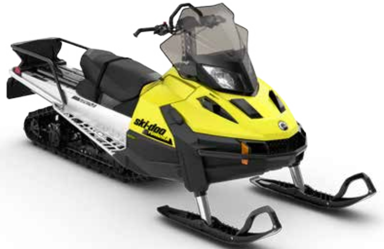
Kuvassa TUNDRA™ LT 600 ACE™