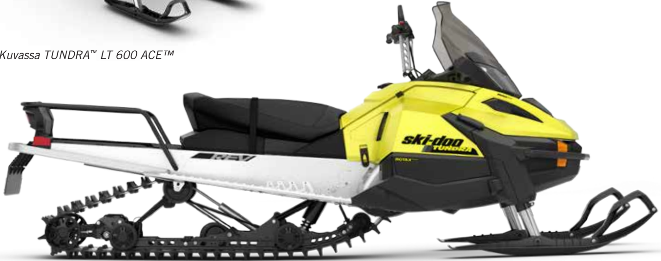
Kuvassa TUNDRA™ LT 600 ACE™